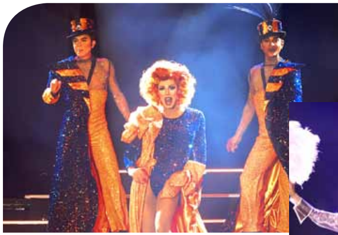
Immer überraschend, immer anders: Mit dem großen Finale setzt Show-Regisseur Ralf Kuta Glanzpunkte der Extraklasse.