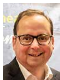
Thomas Kufen, Oberbürgermeister der Stadt Essen

Sprüchen, über die sich die Gäste noch kaputtlachen, wenn sie ihren Lieben daheim vom Theaterabend erzählen. Mit dieser Inszenierung hat sich das Haus für den Generationenwechsel neu aufgestellt. Glückwunsch!